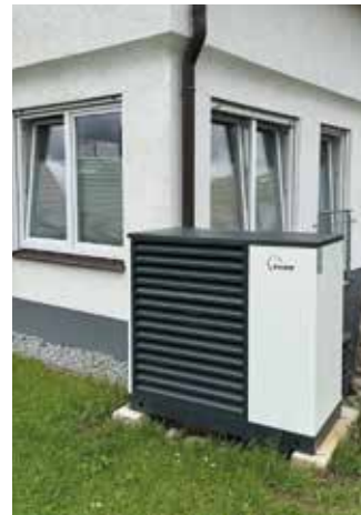
Wärmepumpe – effizient, leise, nachhaltig.

Von der Bestandsaufnahme über die Planung bis zur Inbetriebnahme begleitet der Betrieb alle Schritte. Auch wäh-