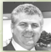
KITCHEN COMPANY Guten Morgen.