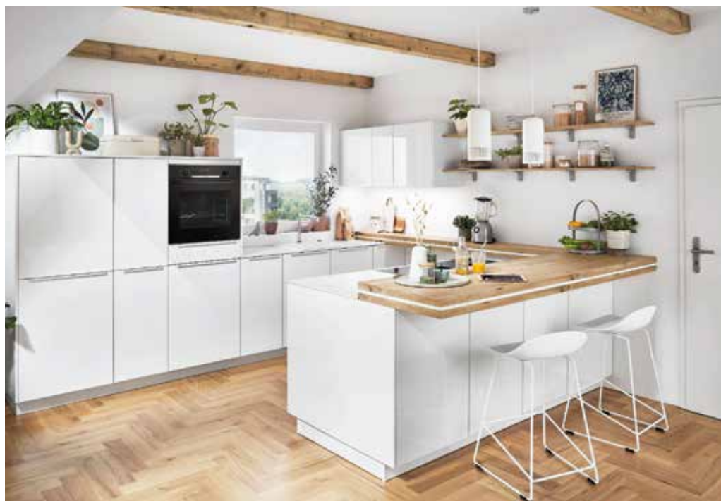
Holztheke zum Wohlfühlen