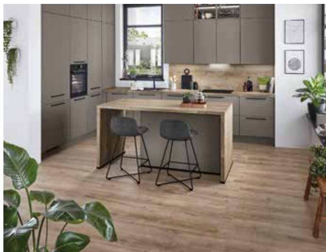
Insellösung mit Wasserfall-Platte