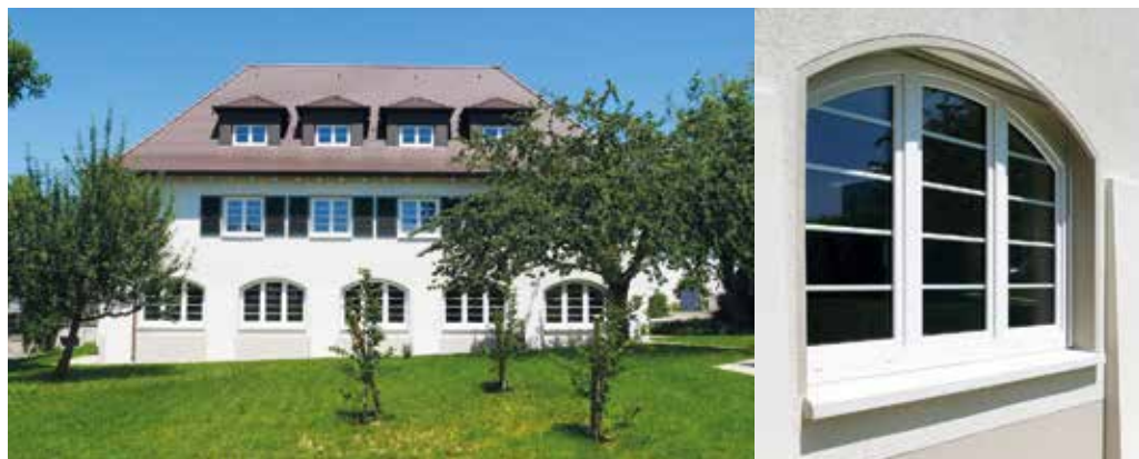
Die Fassadengestaltung mit Segmentbogenfenstern

bundsystem keineswegs im Widerspruch zu einem sensiblen Umgang mit historischer Architektur steht. Im Gegenteil: Mit handwerklichem Können, gestalterischer Klarheit und Liebe zum Detail lassen sich energetische Anforderungen und architektonische Qualität in Einklang bringen.