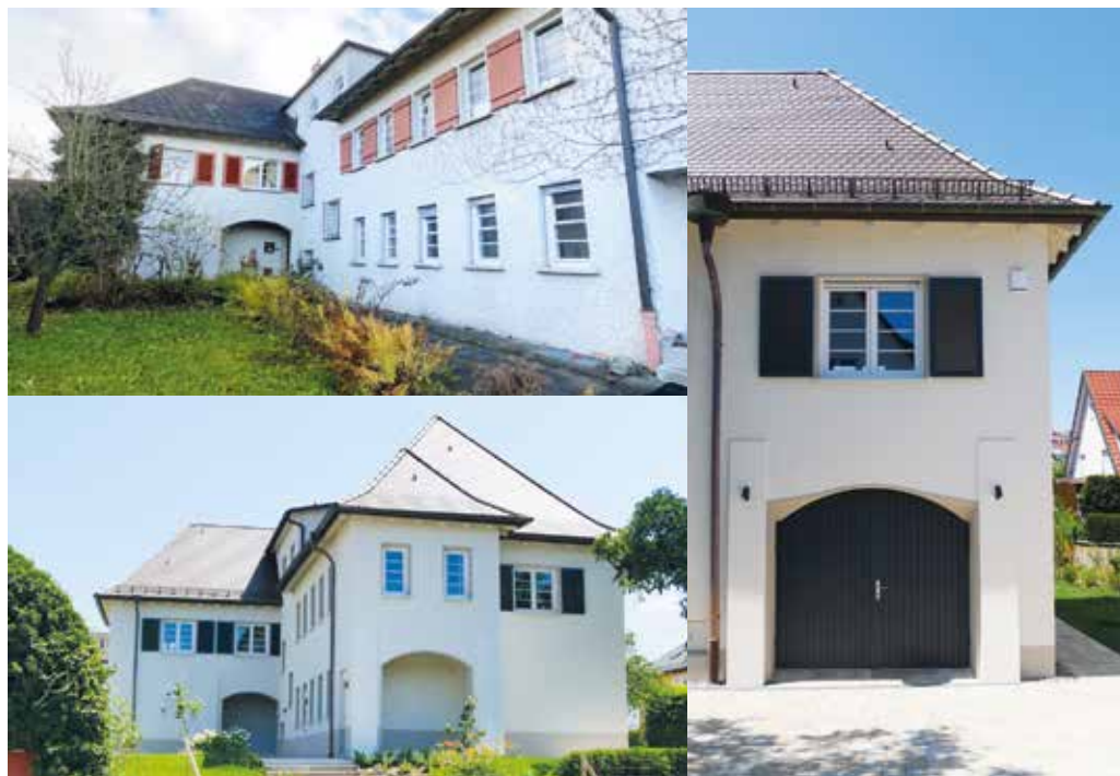
Das Gebäude vor und nach der Sanierung.

Wärmedämmverbundsysteme gelten oft als rein funktionale Maßnahme. Dieses Projekt beweist das Gegenteil.