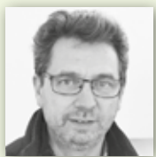
FEUERGALERIE LEINWEBER Erfüllen sie sich ihren Traum vom eigenen Feuer.