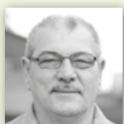
WAILAND BETTWARENFABRIKATION Frühjahrs-Schlafcheck: Zeit für eine neue Matratze.