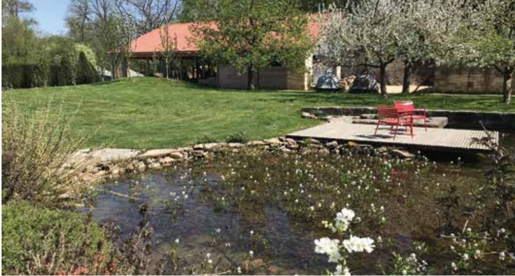
Ein gut geplanter Garten ist Lebensqualität pur.

Der Gärtnerhof Jeutter in Göppingen gestaltet individuelle, langlebige Gärten mit Naturmaterialien und Biodiversität. Workshops und ein regelmäßiger Stammtisch fördern Wissen und Austausch