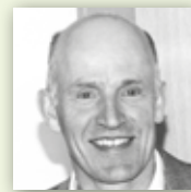
STUCKATEUR HOFELE Energetische Sanierung – ausgezeichnete Gestaltung.