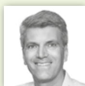
EP: MARZINI ELECTRONIC PARTNER Service und Nachhaltigkeit aus Tradition.