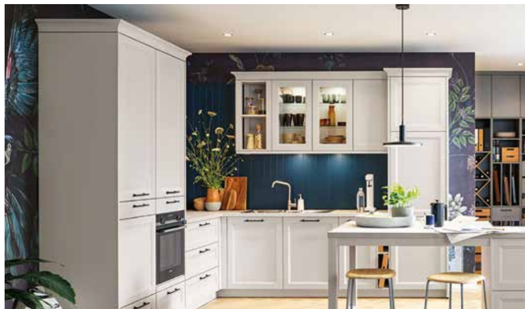
Arbeitsplatte als Tisch mit Sitzmöglichkeit