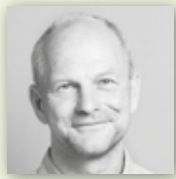
JEUTTER GÄRTEN UND PFLANZEN Der Garten als Lebensraum.