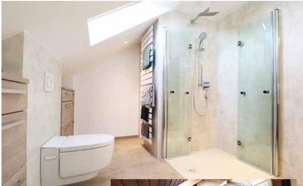
Vom Altbad zum Traumbad: Vorher & Nachher.

Ein neues Badezimmer oder eine moderne Heizung sind Investitionen, die gut geplant sein wollen.