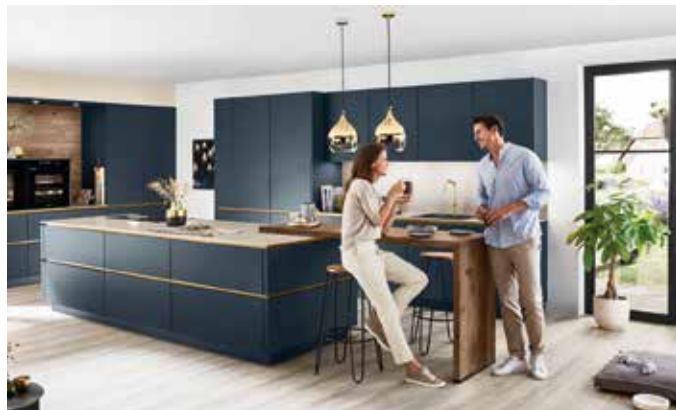
Hier verlängerte Arbeitsplatte – ein gemütlicher Thekenplatz

Platz kann ein Esstisch sein, ein separater Küchentisch – oder eben die Theke an der Kochinsel, die mit ihrer unmittelbaren Nähe zur Kaffeemaschine, Kühlschrank und Geschirrrregal der ersten Mahlzeit des Tages