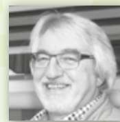
ROLLADENBAU DÄHS GMBH Aktion Winterpreise auf Markisen noch bis zum 31.03.2026.