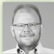
HÄFELE BAD & WÄRME Komplettleistungen für Bad und Heizung – zuverlässig aus einer Hand.