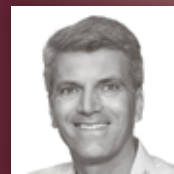
EP: MARZINI ELECTRONIC PARTNER Jubiläumsangebote im Oktober und neue Geräte im umgebauten Showroom