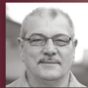
WAILAND BETTWARENFABRIKATION Bettdecken aus Alpakawolle – natürlich gut