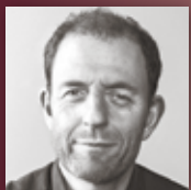
HYDROGÄRTNEREI HÖFER Pflanzen im Innenraum gekonnt in Szene setzen