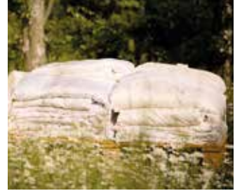
Bei der Firma Wailand finden Sie alles rund um den natürlich guten Schlaf.