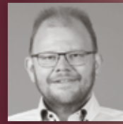
HÄFELE BAD & WÄRME Die höchste Kunst der Badgestaltung