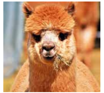
Alpaka-Wolle: Der Superheld unter den natürlichen Rohstoffen.

Alpakawolle ist außerdem be-sonders hautfreundlich. Die Fa-ser enthält kaum Lanolin und muss nicht aufwendig chemisch gereinigt werden. Darüber hi-naus ist sie auch gut für Haus-staubmilbenallergiker geeignet, da sie von Natur aus antistatisch und somit staubabweisend ist. Das ist übrigens auch der Grund dafür, dass sie sich nicht elek-trisch auflädt.