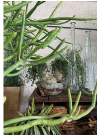
Noch ein kurzer Rückblick auf unsere erfolgreiche Teilnahme an der Bundesgartenschau in Mannheim im Sommer 2023.