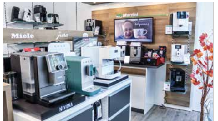
Bei den Kaffeevollautomaten gibt es attraktive Angebote.

Kaffeemaschinen-Welt mit hochwertigen Vollautomaten, Elektro-Haushaltsgroßgeräte, Kleingeräte namhafter Markenhersteller wie zum Beispiel Kühlschränke, Herde und Backöfen, Waschmaschinen und Trockner, Geschirrspüler sowie zahlreiche Alltags-elektronik vom Fön bis hin zur elektrischen Zahnbürste.