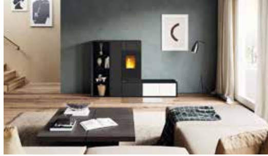
CONNECT von RIKA: Dank modularer Anbau- und Zubehörteile unbegrenzte Gestaltungsfreiheit.