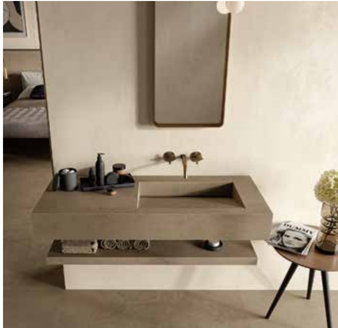
Die Waschbecken aus Fliesenmaterial lassen sich an die individuell gewünschten Maße anpassen, sehr gut mit Badmöbeln kombinieren und verleihen dem Bad eine besonders durchdachte Optik.

In neu gestalteten Ausstellungskojen zeigt Häfele Bad & Wärme frische Ideen und exklusive Möglichkeiten für die individuelle Badgestaltung. Bei der Langen Nacht des Bades und dem anschließenden Tag der offenen Tür werden die beiden neuen Musterbäder erstmals präsentiert.