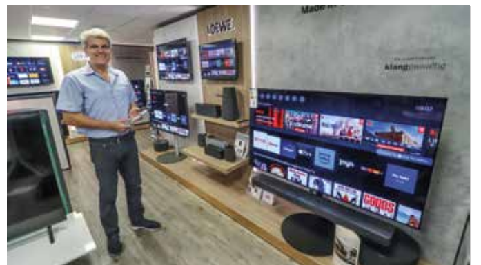
Moderne Geräte an der neu gestalteten Loewe-Wand.

Jahre feiern kann, gibt es im EP:Marzini-Fachgeschäft für Haushaltsgeräte noch bis Ende Oktober attraktive Aktionen. EP:Marzini selbst feiert aktuell zwar kein Jubiläum – dennoch feiert das Team mit seinen Herstellern und so gibt es für die Kunden bis Ende Oktober ein Jubiläumspräsent beim einem Einkauf.