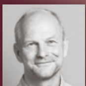
JEUTTER GÄRTEN UND PFLANZEN Gut geplant und gepflanzt – für den Gartengenuss das ganze Jahr