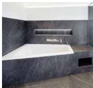
Die Besondere LED-Beleuchtung setzt die Nische in Szene.