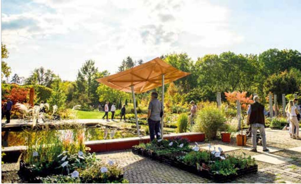
Auf dem Gärtnerhof im Marbachtal gibt es eine große Pflanzenauswahl.