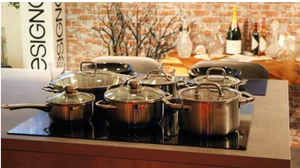
Musterküche mit hochwertiger Ausstattung.