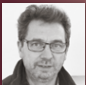
FEUERGALERIE LEINWEBER Behagliches Flammenspiel um's Eck gedacht!