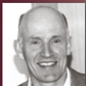
STUCKATEUR HOFELE Luftfeuchtigkeit vermeiden