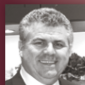
KITCHEN COMPANY Alles aus einer Hand