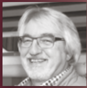
ROLLADENBAU DÄHS GMBH Warum jetzt Fenster wechseln?

Garantie Vor, während und nach unserer Leistung