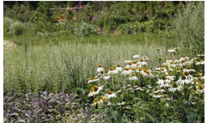
Die Jeutter-Philosophie wurde bereits mehrfach ausgezeichnet.

bei der Auswahl der richtigen Pflanzen wider. „Wir wissen, wie man die Pflanzen kombiniert – für einen nachhaltigen und pflegeleichten Garten zu