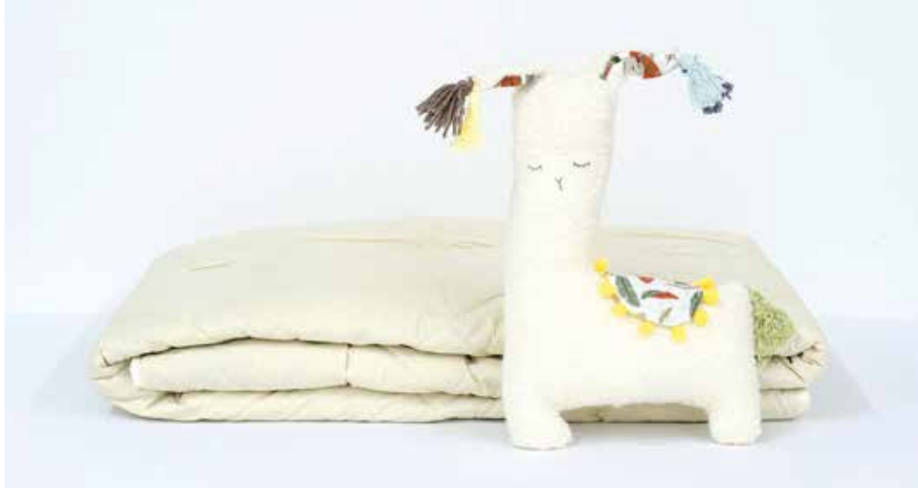
Die Alpaka-Bettdecke „Alpnest“ der Firma Wailand.

Bereits Aristoteles wusste „Die Natur schafft immer von dem was möglich ist das Beste“. Diese Aussage nimmt sich die Firma Wailand zu Herzen und greift für die Herstellung Ihrer Bettwaren auf „das Beste“ der Natur zurück.