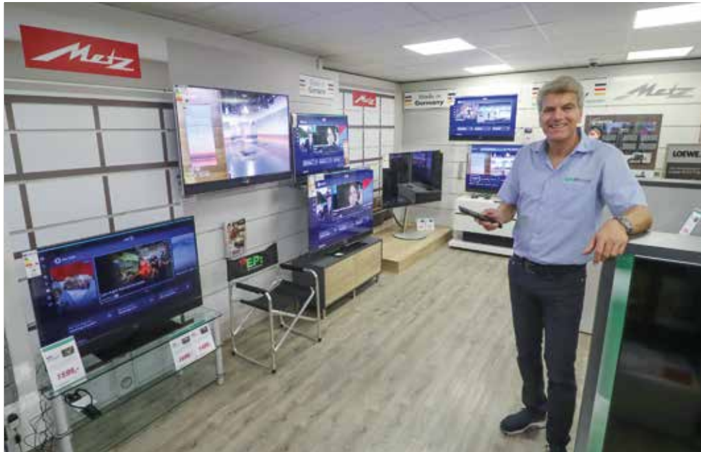
Große Auswahl an TV-Geräten von deutschen Herstellern.

Die Göppinger Fachgeschäfte von EP:Marzini haben Jubiläumsangebote – und bis Ende Oktober attraktive Aktionen der namhaften Markenhersteller.